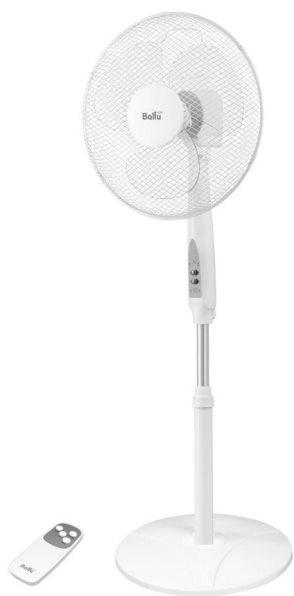
BFF – 810R